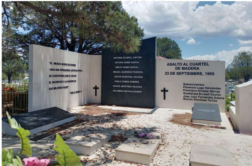
Memorial a los guerrilleros caídos durante el asalto al cuartel militar de ciudad Madera en 1965.

Comunista 23 de Septiembre (LC23S) que tuvieron presencia durante las décadas de 1960 y 1970.