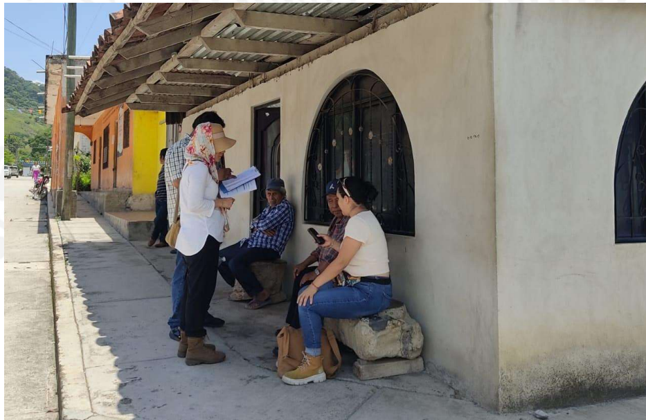
Levantamiento de testimonios respecto a las matanzas de campesinos indígenas ocurridas en Rancho Nuevo y Monte Chila, en la sierra norte de Puebla, durante la década de 1970 y 1980.

En la misma región entrevistamos testigos de la masacre ocurrida en Monte Chila durante la década de 1970. Se visitaron las localidades de San Pedro Tlaolantongo, Finca Oro Verde y Reyes Tecuantla, en el municipio de Jopala, Puebla.